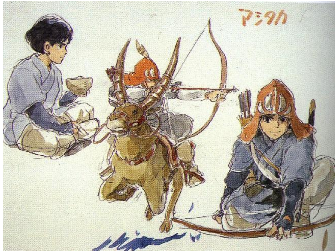
もののけ姫 ・ アシタカ